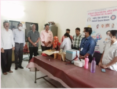
कोविड-१९ लसीकरण करीता आयोजित आरोग्य शिबीराचे उद्घाटन करताना संस्थेचे चेअरमन मा.हेमंतशेठ नाईक व मान्यवर