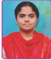
उपाध्ये ऋतुजा महेश महाविद्यालयत कला विद्याशाखेतून प्रथम(भूगोल विषयातून प्रथम) (तृतीय वर्ष कला)