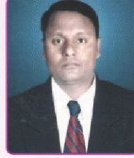
डॉ.बी.जी.मुख्यदल सह संपादक