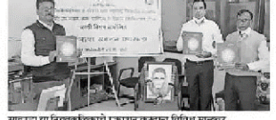
सातपुडा या साहित्यिक प्रकाशनाच्या संस्कारित मनाला संस्कारित करते.

प्रतिनिधी | रावेर मराठी साहित्य हावणी यांची पारंपारिक अर्थ, राठोळीक अंतर्गत साहित्यिक प्रकाशनांमधील सातपुडा या साहित्यिक प्रकाशनाच्या संस्कारित मनाला संस्कारित करते. सातपुडा या साहित्यिक प्रकाशनाच्या संस्कारित मनाला संस्कारित करते. सातपुडा या साहित्यिक प्रकाशनाच्या संस्कारित मनाला संस्कारित करते.