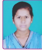
चौधरी हर्षाली दिनकर महाविद्यालयत वाणिज्य शाखेतून प्रथम (तृतीय वर्ष वाणिज्य)