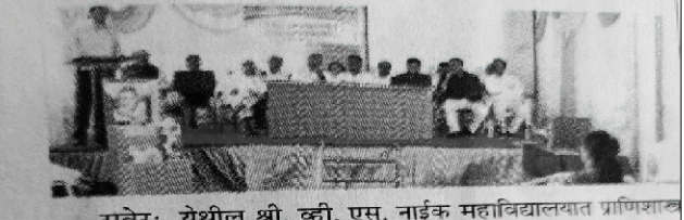
रावेर: येथील श्री. व्ही. एस. नाईक महाविद्यालयात प्राणिशास्त्र अभ्यासक्रमाचा पुनर्रचना कार्यशाळा.