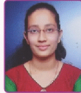
चौधरी वेदीका रवींद्र स्वायत्तशास्त्र विषयात प्रथम (तृतीय वर्ष विज्ञान)