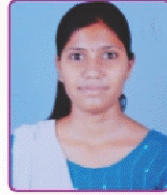
पाटील मायत्री धोंडू महाविद्यालयत अर्थशास्त्र विषयात प्रथम (तृतीय वर्ष कला)