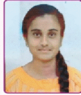
तडवी परविन अहमद महाविद्यालयत इंग्रजी विषयात प्रथम (तृतीय वर्ष कला)