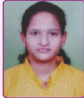
चौधरी प्रियंका लक्ष्मण महाविद्यालयत विज्ञान विद्याशाखेतून प्रथम (भौतिकशास्त्र विषयात प्रथम) (तृतीय वर्ष विज्ञान)